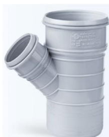
سه راهی تبدیل ۴۵ درجه .