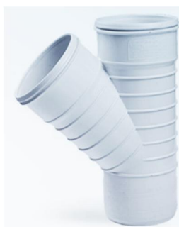
سه راهی ۴۵ درجه .