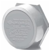
درپوش روکار .