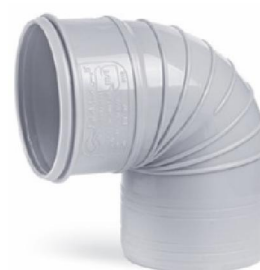
زانوی ۹۰ درجه .

با توجه به نوسانات قیمت، قبل از ثبت سفارش از آخرین تخفیفات واحد فروش اطمینان حاصل فرمایید. (اسفند ۹۸)