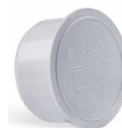
درپوش توکار .