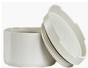
دریچه بازدید تویچ .