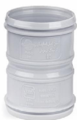
کوپلینگ ترمزدار .