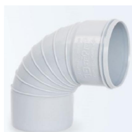
زانوی خم ۸۷/۵ درجه یک سر کوبله .