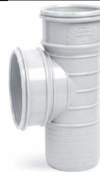
سه راهی ۹۰ درجه .