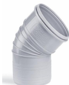
زانوی ۴۵ درجه .