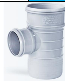
سه راهی تبدیل ۹۰ درجه .