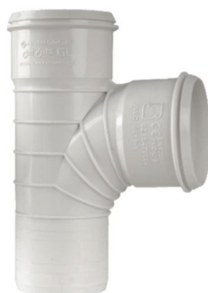
سه راهی خم ۸۷/۵ درجه .