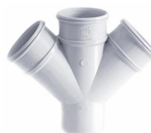
چهارراه ۴۵ درجه .