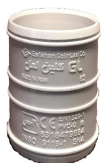
کوپلینگ بدون ترمز .