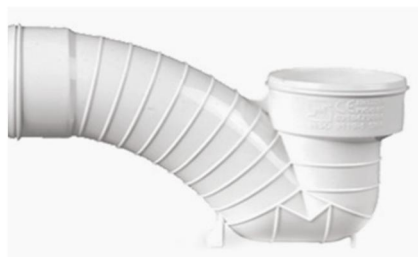
سیفون کامل .