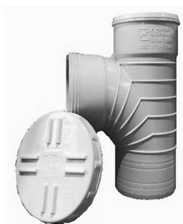
سه راهی ۸۷/۵ درجه دریچه بازدید.