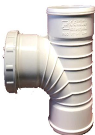
سه راهی ۸۷/۵ درجه دریچه بازدید دو سر کوپله .